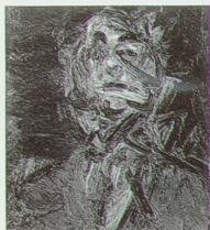
The Day the World Turned Auerbach , 1991 (O Dia em que o Mundo Ficou Auerbach)

The End of the 20th Century (O Fim do Século XX) de 1996, é uma de duas versões feitas a partir de reproduções do quadro de Fragonnard existente na Wallace Collection, Londres.