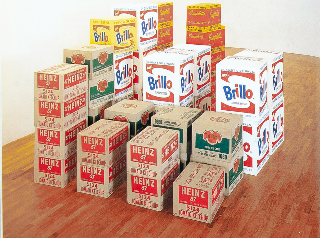
100. Caisses variées, 1964 Andy Warhol

...En se dégradant, le réalisme, fût-il nouveau, fût-il un réalisme de la « Différence », devient lui aussi académique.