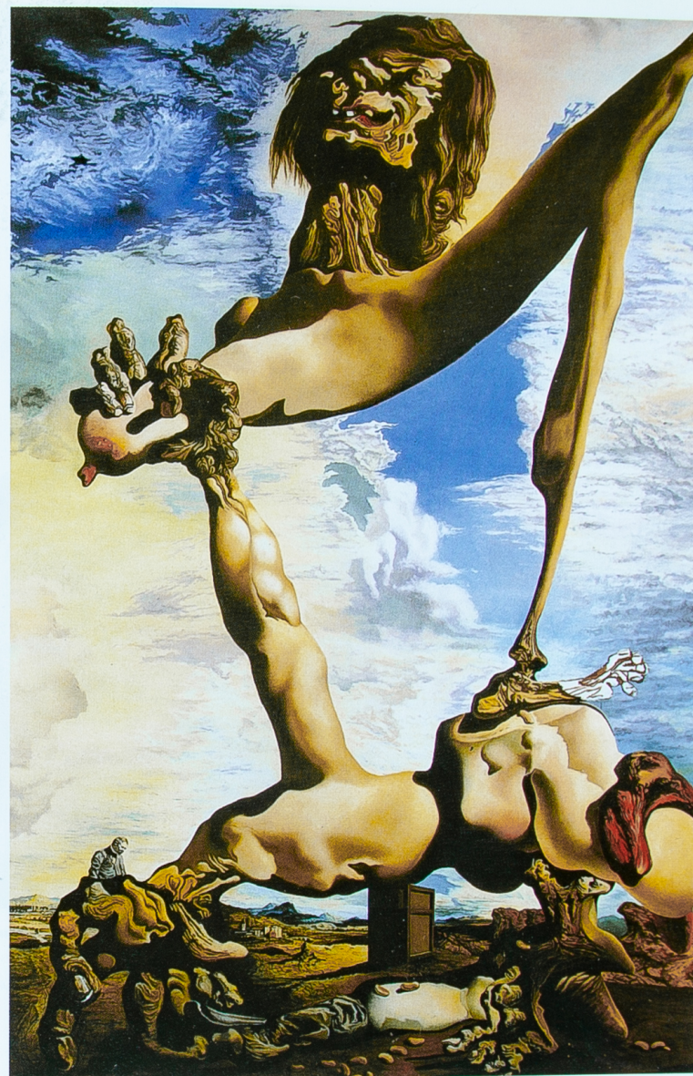
101. Dali-Christ, 1992 Glenn Brown

...En se dégradant, le réalisme, fût-il nouveau, fût-il un réalisme de la « Différence », devient lui aussi académique.